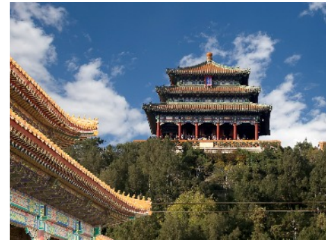
Jingshan Park-Wanchun Pavillion, Peking