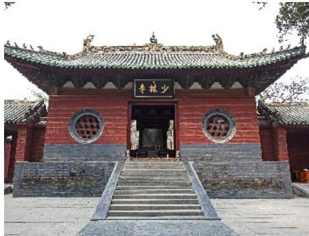
Tor zum Shaolin-Tempel