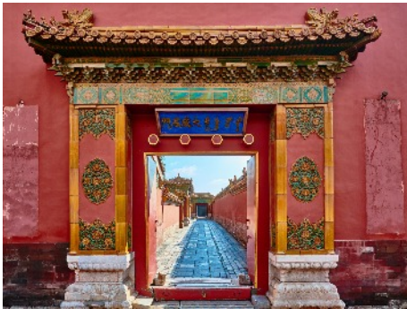
Tor in der Verbotenen Stadt, Peking