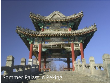
Sommer Palast in Peking