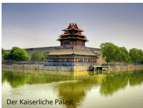
Der Kaiserliche Palast

Ankunft in Deutschland und individuelle Heimreise.