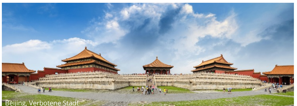
Beijing, Verbotene Stadt