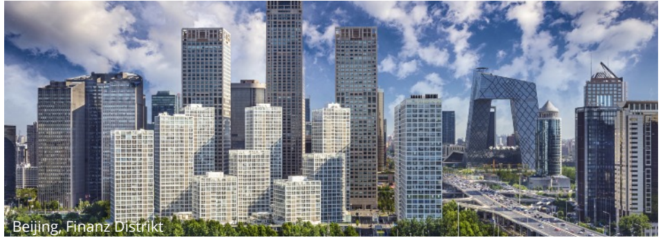
Beijing, Finanz Distrikt